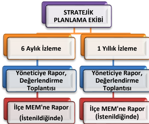
Şekil 2 Stratejik Plan İzleme ve Değerlendirme Modeli

Müdürlüğümüzün 2024-2028 Stratejik Planı İzleme ve Değerlendirme sürecini ifade eden İzleme ve Değerlendirme Modeli hazırlanmıştır. Okulumuzun Stratejik Plan İzleme-Değerlendirme çalışmaları eğitim-öğretim yılı çalışma takvimi de dikkate alınarak 6 aylık ve 1 yıllık sürelerde gerçekleştirilecektir. 6 aylık sürelerde Okul Müdürüne rapor hazırlanacak ve değerlendirme toplantısı düzenlenecektir. İzleme-değerlendirme raporu, istenildiğinde İlçe Milli Eğitim Müdürlüğüne gönderilecektir.